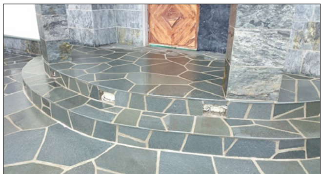
Vabakujuline looduskivi trepil ja parkimisalal