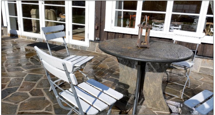
Looduskivist laud kiviterrassil

Kivikaitset, mis on teostatud Steinfix sarja toodetega, hoiavad kivid hingavatena ega moodusta kivi pinnale veeauru tõkestavat kilet.