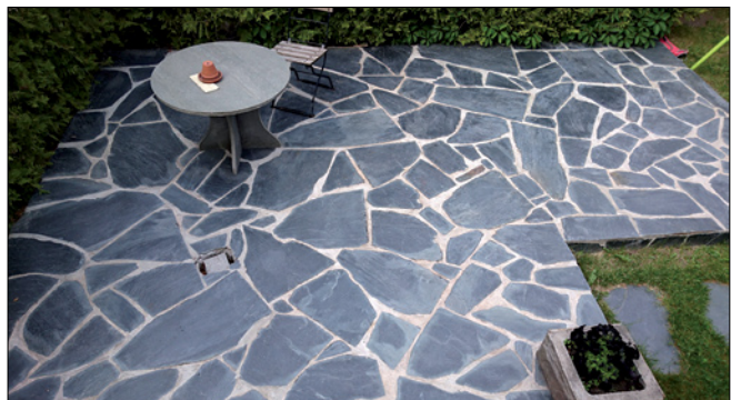
Looduskivi, hele vuuk