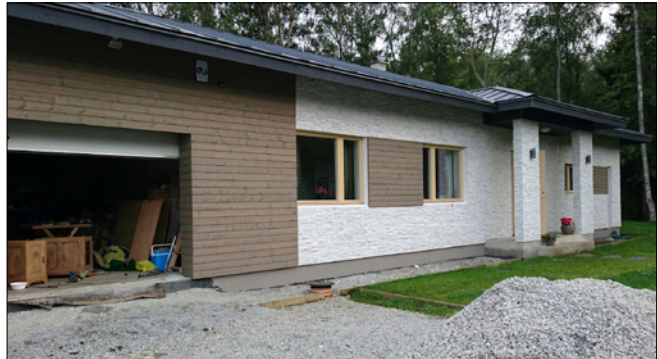
Looduskivi paigaldus Lammi plokile