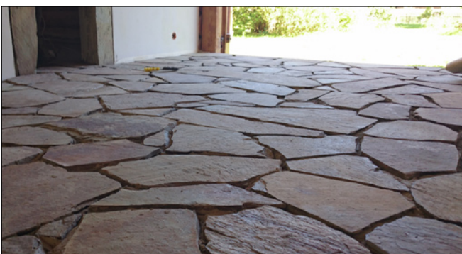
Vuukimata looduskivi – vuugitakse hiljem