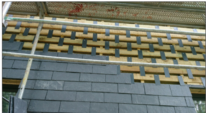
Looduskivist fassaad kruvikinnitusega