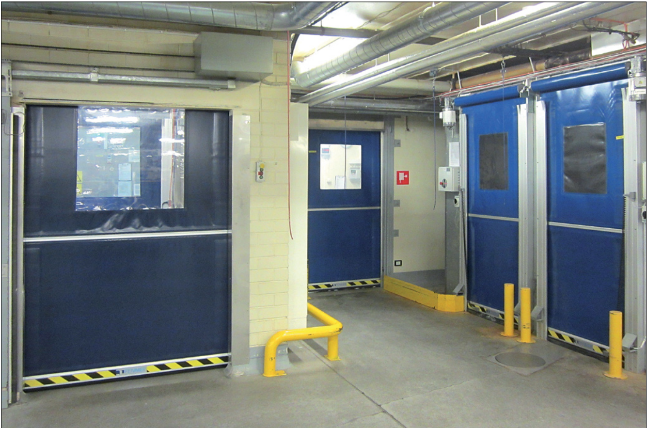
Fendoor-kiirrukkused tehnoloogia teenistuses