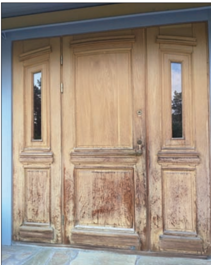
Välisuks enne ja pärast restaureerimist

Pärast akna või ukse valmistamist teostab Pumeko AS paigalduse ja annab garantii.