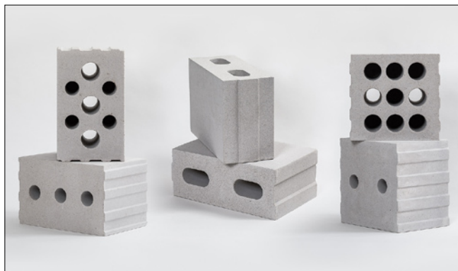
Vasakult: Silikaatplokk 180 Strong, Silikaatplokk 120 Slim, Silikaatplokk 240 Silence

Silikaatploki paigaldamise kohta saab infot www.silikaat.ee